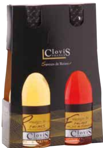
Pack Vinaigre de Reims et Vinaigre de Reims au jus de framboise, 2 x 250 ml