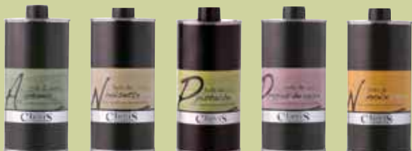
Bouteilles de 500 ml

Sélectionnées avec la plus grande rigueur, les Huiles d'Amande, de Noisette, de Noix, de Pépins de raisin, de Pistache permettent d'aromatiser les plats (poissons, salades composées...) et de surprendre les papilles !